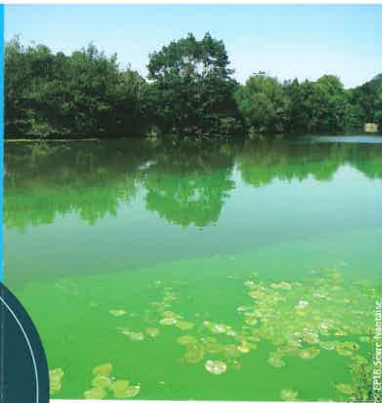
Cyanobactéries sur la Sèvre Nantaise, août 2018

en restaurant les milieux aquatiques pour leur redonner un fonctionnement plus naturel et leur apporter une meilleure capacité d'autoépuration.