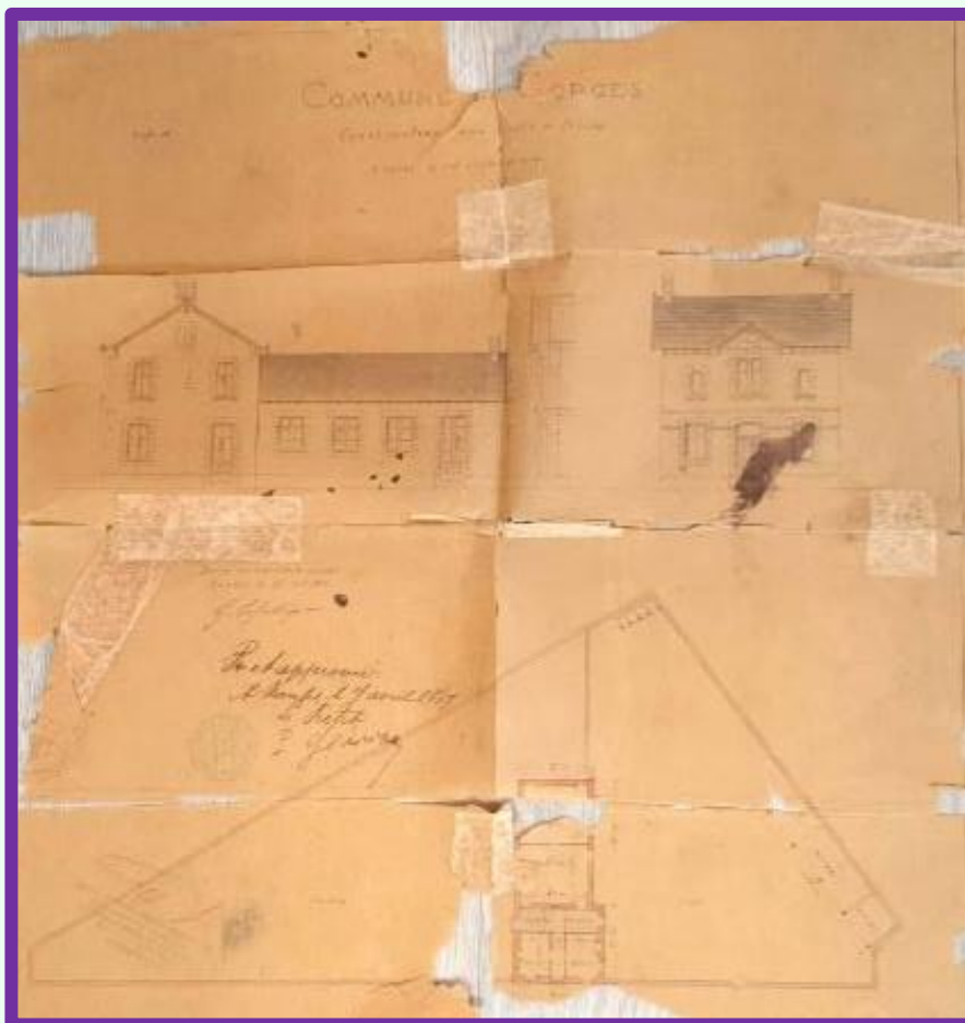
Figure 5. Plan de l'école communale de filles. En haut, détails de la façade. En bas, organisation du bâtiment et de la cour. Archives municipales de Gorges.

Le chantier pour la création de l'école communale de jeunes filles commence donc au début des années 1880 . Là encore, on retrouve dans les archives municipales de Gorges des informations sur la création de cette école. Par exemple, on trouve un plan détaillant l'organisation de cette école, mais aussi des correspondances retraçant l'évolution du projet et du chantier.