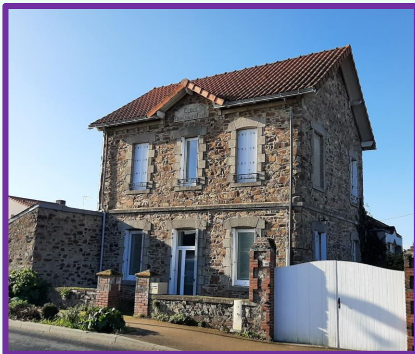
Figure 6. Ancienne école communale de jeunes filles, à proximité de l'actuelle poste.