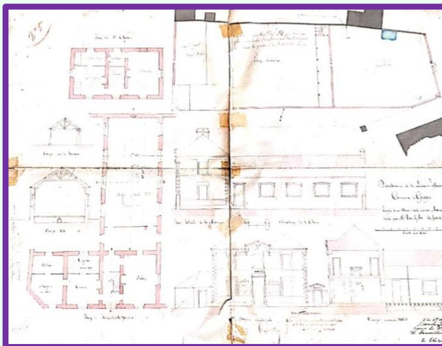
Figure 3. Plan détaillé de la nouvelle maison d'école. Détails de la façade. Archives municipales.

Le nouveau bâtiment se doit de remplir également cette « triple fonction ». Cette fois, hors de question de construire un bâtiment trop petit. Les plans réalisés à l'époque témoignent de la volonté de construire une maison spacieuse et pratique.