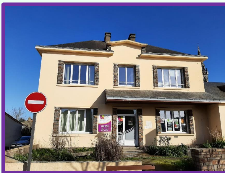
Figure 4. Vue actuelle de la nouvelle maison d'école.

Ce bâtiment est toujours visible aujourd'hui. En effet, les gorgeois auront peut-être reconnu un bâtiment situé sur la place Maurice Renoul. Ce bâtiment accueille aujourd'hui les locaux de la Mission Locale, mais aussi la salle du Cep.